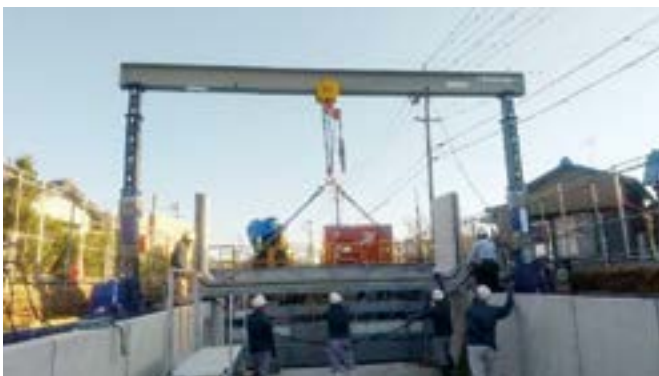
U型水路据付工事 トラックの荷台から直接取卸し据付を行っています