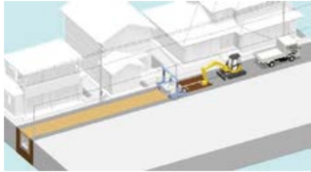
市街地のボックスカルバート据付