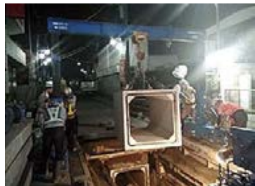
ボックスカルバート据付工事 道路が狭く4tトラックで小運搬後据付