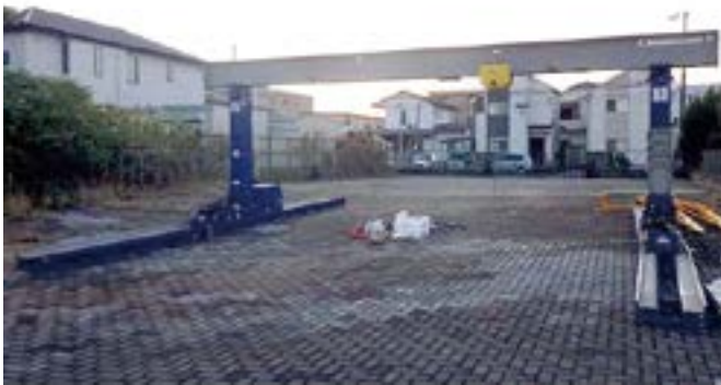
10tリフター レール走行タイプ ※この機種は9mビームがとりつけてあります