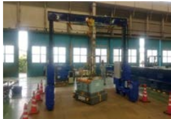
5tリフター レールレスタイプ